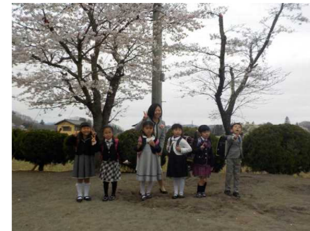
【満開のさくらの下でピース!】