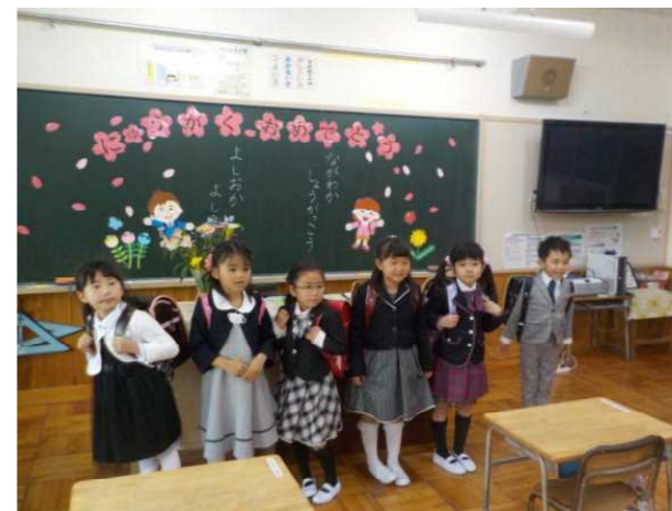
【1年生教室でパシャ!】