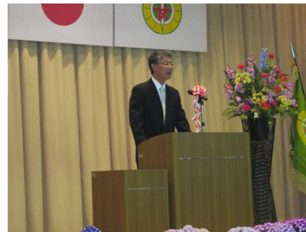
【校長先生のことば】