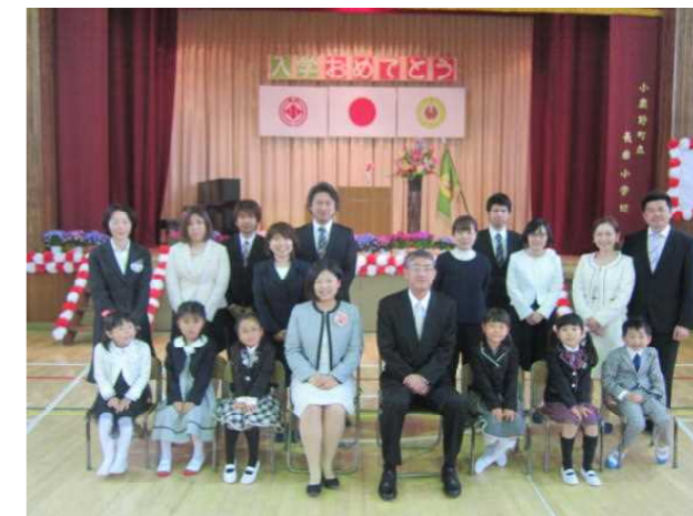
【新入児童・保護者記念写真】