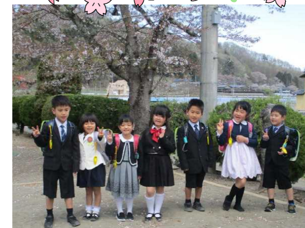
【さくらの下でピース!】