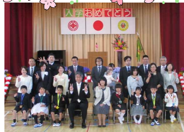
【新入児童・保護者記念写真】