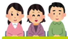
令和5年度 保護者による学校評価（12月実施）