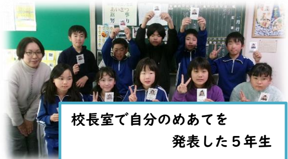
校長室で自分のめあてを 発表した5年生