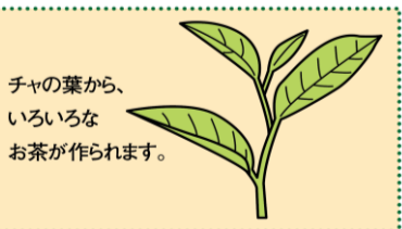
チャの葉から、いろいろなお茶が作られます。

お茶は、ツバキ科の常緑樹「チャ」の葉から作られます。緑茶のほか、ウーロン茶や紅茶も同じチャの葉を原料としますが、チャの木の品種、加工方法の違いで、香りや味は大きく異なります。