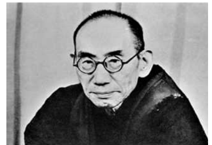
西田 幾多郎 (にしだ きたろう) (1870~1945)

私たちが学ぶ意味もまた、ここにあるのではないのでしょうか。知識を覚えることにとどまらず、見て、感じて、考え、自分の言葉で捉え直していく、その積み重ねによってこそ学びは確かな力と なっていくます。